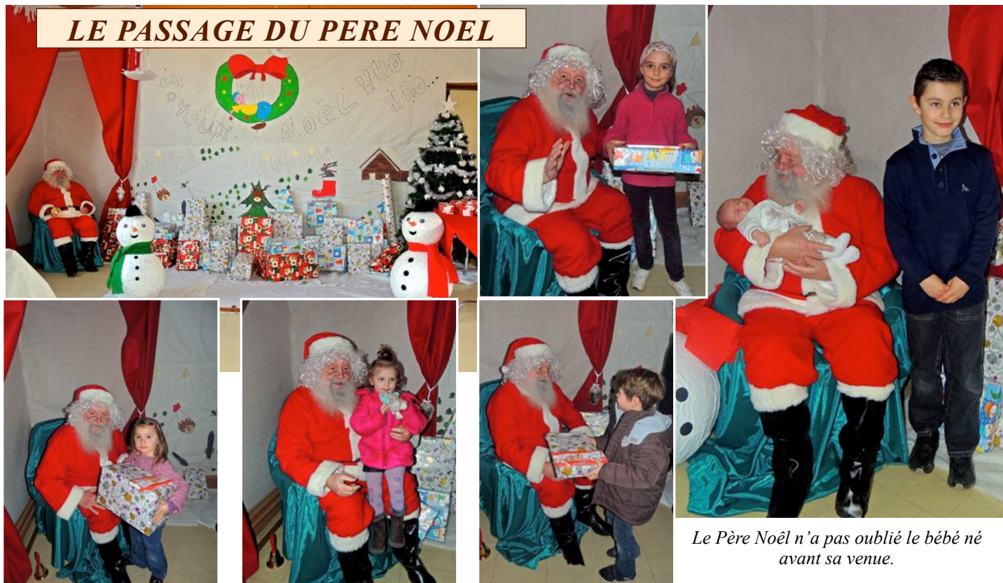
Le Père Noël n'a pas oublié le bébé né avant sa venue.

Noël est toujours aussi magique pour les tous petits. Joie, sourire, enthousiasme se lisait sur le visage des enfants lors de la distribution de jouets. Le Père Noël toujours aussi fringant et jovial a distribué aux 64 enfants de moins de 10 ans les jouets qu'ils avaient commandés.