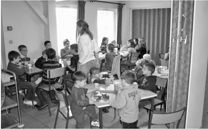
L'espace réservé aux repas où se retrouvent petits et grands salle communale de Dammard