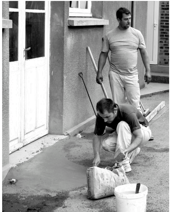
Amélioration de l'accès à la salle communale.

Encore un grand merci à tous ces bénévoles qui travaillent à l'amélioration des conditions de vie et du bien commun du village.