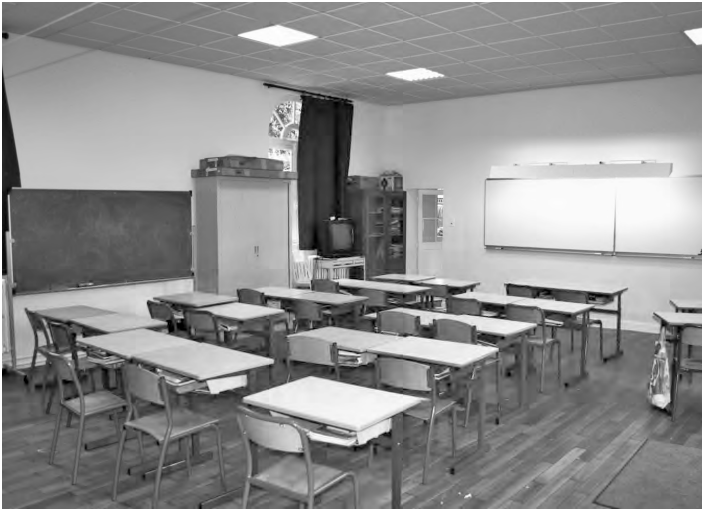
La classe rénovée