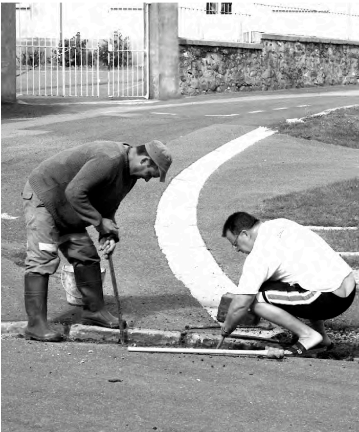
Abaissement des bordures côté école et côté église.