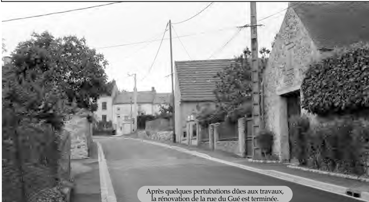
Après quelques perturbations dûes aux travaux, la rénovation de la rue du Gué est terminée.