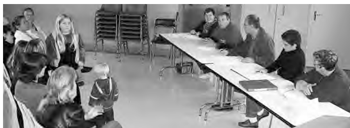
samedi 7 juin en mairie réunion de la commission des fêtes et animations .

(Bulletin à déposer en Mairie avant le 30 juin ).