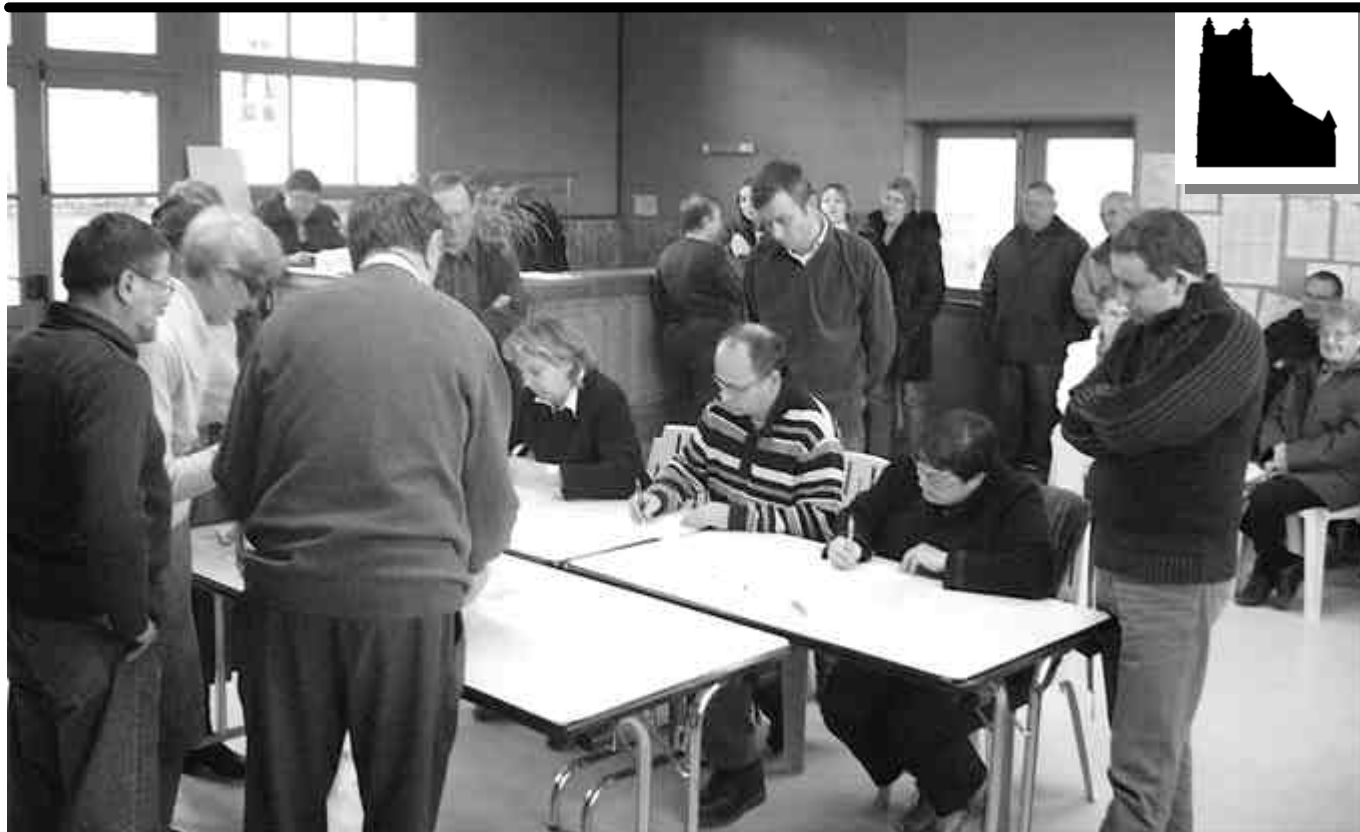
Dépouillement lors des élections municipales de mars 2008 à la salle des fêtes.