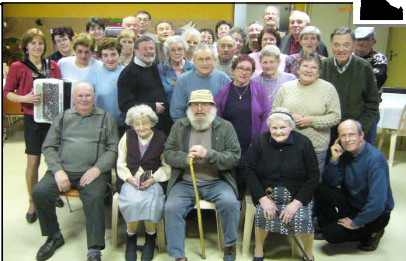
Voilà les piliers du village en pleine forme après le repas de fin d'année 2007. Nous leurs souhaitons plein de joie pour 2008 et surtout une bonne santé Et une joyeuse et prospère nouvelle année à tous les habitants de Chézy et à leur famille.