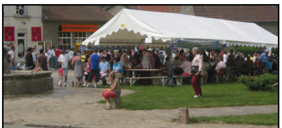
Ces photos et bien d'autres sont visibles chaque week-end de 9h à 18h au jeu d'arc de Chézy. Vous pouvez en commander.