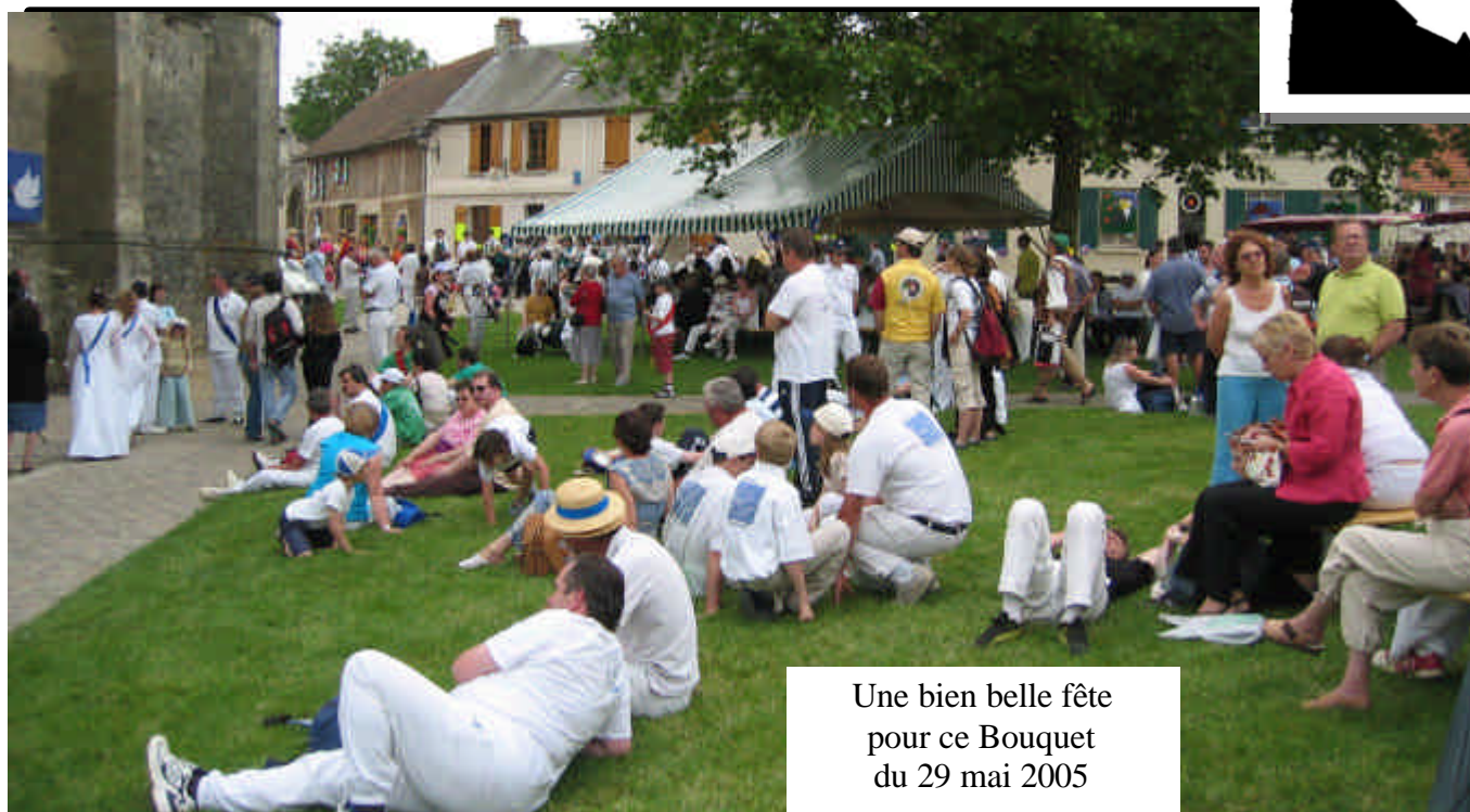
Une bien belle fête pour ce Bouquet du 29 mai 2005