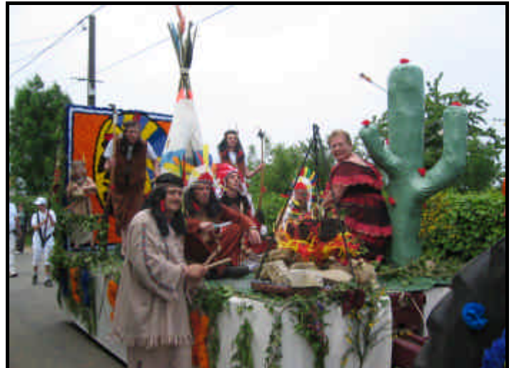
Ces photos et bien d'autres sont visibles chaque week-end de 9h à 18h au jeu d'arc de Chézy. Vous pouvez en commander.