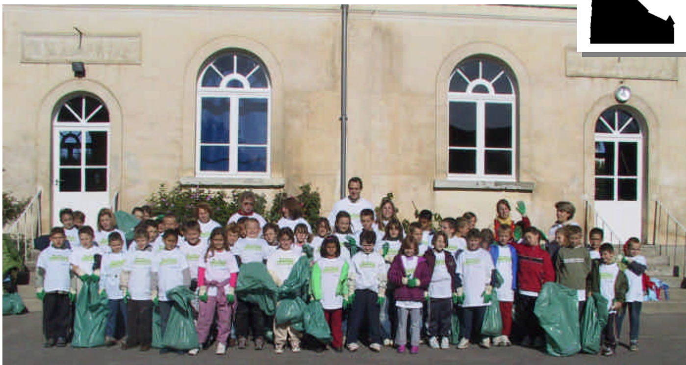
Ils ont nettoyé le village le 25 septembre 2004 et vous raconteront cette aventure dans le prochain journal