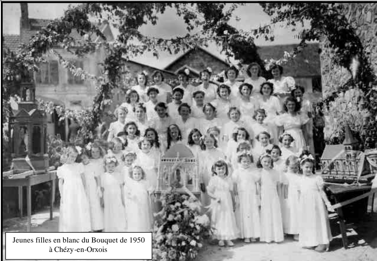
Jeunes filles en blanc du Bouquet de 1950 à Chézy-en-Orxois

Des informations seront régulièrement données sur les besoins et l'avancement du projet