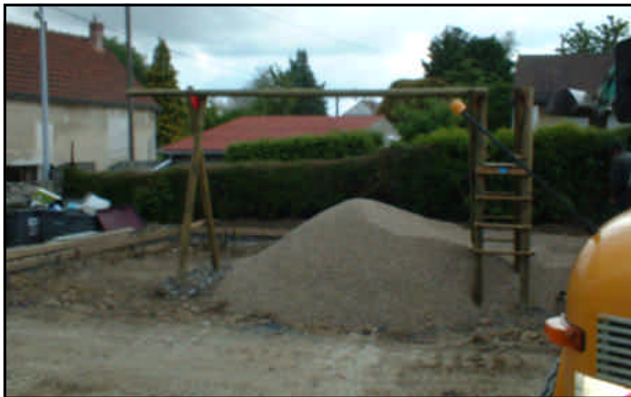
Un dernier souvenir, avant l'achèvement des travaux.

Mais attendez encore l'ouverture officielle pour emmener vos enfants.