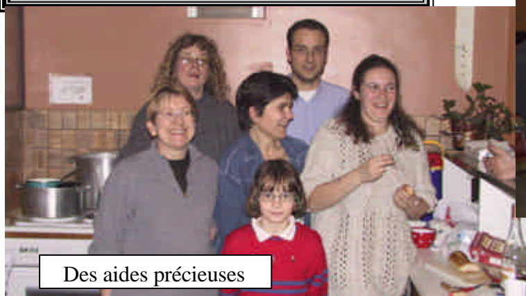
Des aides précieuses