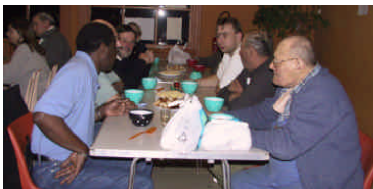
Soupe à l'oignon appréciée ....

Encore un grand merci aux archers qui sont des «pros» de l'organisation et aux joueurs qui ont permis que nous réalisions une recette en partie réinvestie quelques jours plus tard pour offrir des livres et un goûter de crêpes aux enfants costumés pour mardi gras.