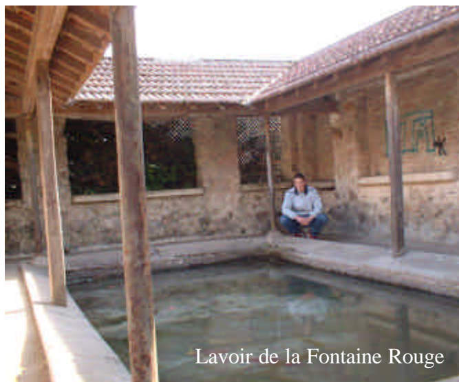
Lavoir de la Fontaine Rouge

Et si l'on s'occupait de nos lavoirs ?? Ils sont nombreux, beaux, en pas trop mauvais état .... Alors ? Cela aussi fait partie de nos souvenirs, du patrimoine, de notre vie .... Redonnons vie à ces lieux qui ont vu pendant longtemps une animation forte, faite de travail, de rencontre et de joie aussi, malgré la dureté du monde des lavandières.