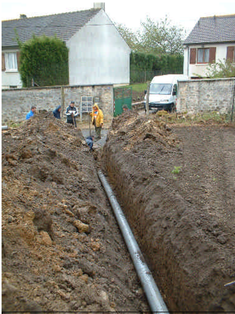
Le tuyau va vider le trop plein du fossé vers l'égout de la rue du Gué

Depuis les pluies ayant entraîné une inondation des maisons de la rue du Gué il était prévu de creuser un fossé en bas du champ touchant les jardins de ces maisons, à défaut de pouvoir le creuser plus haut, à mi-pente, là où se trouvait jadis un chemin creux avec haie. Le fermier qui dispose de la parcelle en amont des jardins devait la laisser en jachère pour servir d'éponge. Il l'a malheureusement ensemencée en colza.